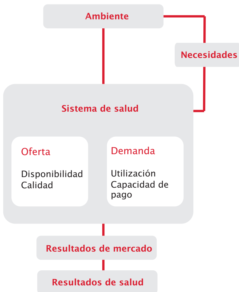
Gráfico 2: Marco conceptual del modelo IMPACT

Este marco considera cinco componentes: ambiente, necesidades, sistema de salud, resultados de mercado, resultados de salud. 7